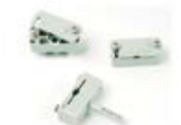
Clema AFH 6414 AC Clema cu diblu încorporat AFH 6415 AC Clema "Suport" AFH 6416 AC