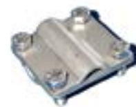
Cupla în linie plat-rotund AFJ 0819 RL