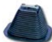
Plot suport platbandă/ conductor AFH 8039 PC