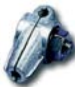
Cupla T AFJ 0817 RT