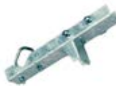
Clemă fixare AFZ 2012 PS