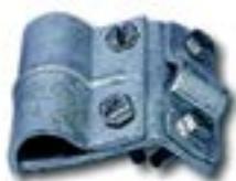
Canal de trecere AFH 2002 PG