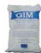
Material îmbunătățire priza pământ AFK 0030 AT