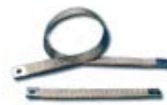
Banda flexibila - cupru AFG 0130 ST - 250 mm AFG 0230 ST - 500 mm AFG 0330 ST - 750 mm AFG 0430 ST - 1000 mm