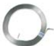
Platbanda AFG 0302 CP - 27x2 mm AFG 0320 CP - 30x2 mm

De asemenea, platbanda este utilizată în mod uzual și pentru realizarea prizelor de pământ.