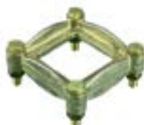
Cupla priză de pământ "laba de gâscă" AFK 0004 RM