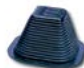
Plot suport fara clemă AFH 8040 PC