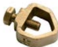
Clema platbandă pentru tarus AFK 0020 RP