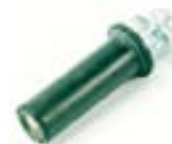
Dop impermeabil + Surub M4 AFH 8050 CE