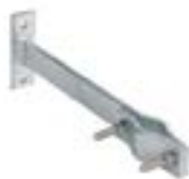
Suport prindere în consola AFZ 0414 PD