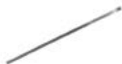
Colier de fixare AFH 1057 CS