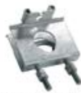
Clemă fixare utilizare multiplă AFZ 2802 FU