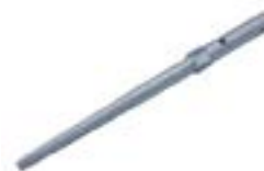
Element de fixare înșurubabil AFD 2005 TC