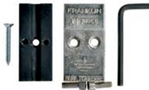
Piesa de separatie AFK 0080 BC

Aceasta se montează la o înălțime de 2m față de sol și se utilizează pentru a separa priza de pământ față de conductorul de coborâre și pentru a permite efectuarea de măsuratori de determinare a rezistenței de dispersie a prizei de pământ.