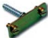
Clema fixare AFH 7000 AC