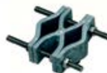
Clemă fixare în cruce AFZ 0417 FC