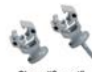
Clema "Suport" AFH 6406 AC - h=18 mm AFH 6408 AC - h=25 mm Clema cu diblu încorporat AFH 6407 AC - h=18 mm