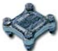
Cupla în cruce plat-plat AFJ 0005 RC