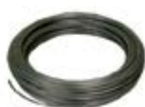
Conductor rotund cupru stanat AFG 0008 CR