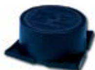
Cutie de vizitare AFK 8001 RV

Cuplele și clemele pentru împământare sunt utilizate pentru realizarea legăturilor între diverse elemente componente ale prizelor de pământ.