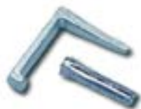
Crampon fixare AFH 2030 CM