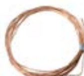
Conductor rotund - cupru AFG 0028 CR